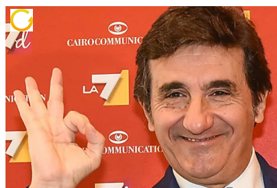
La reputazione online dei manager: Cairo in testa, due donne nella Top...