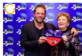
Baci Perugina, Mara Maionchi ed Enrico Nigiotti per l'edizione...